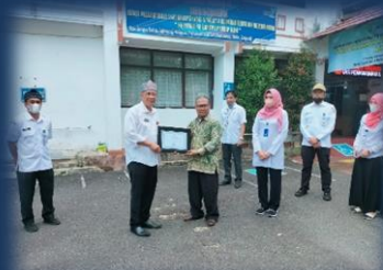
Penyerahan Penghargaan Kepada Pemohon